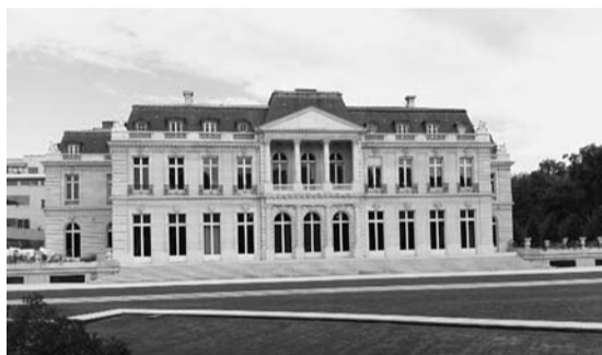
(OECDの建物(通称:シャトー))

さて、OECDは1961年に発足したパリに本部を置く国際機関の一つである。加盟国は、欧州を中心に米国や日本など先進国ばかり34か国となっている。いくつかある委員会の中で、国際課税に関して包括的に取り扱う租税委員会を有している。