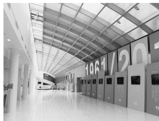
(OECD会議場ビルの廊下)

草案や新しい草案、最終案は加盟国代表の意見を尊重した上で事務局が作成する。草案へのコメントは、専門家であれば誰でも行うことができる。また、公開討論会はインターネットで配信され、日本からも見ることができるとある。この他、BEPSなどの重要課題については、事務局が進行状況について動画を配信している。